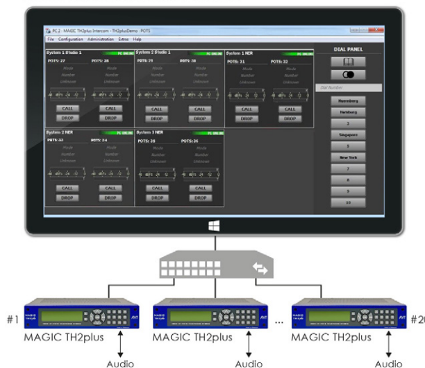
MAGIC TH2plus Intercom PC Software

Para controlar varios híbridos AVT diferentes, la actualización System Manager está disponible como alternativa.